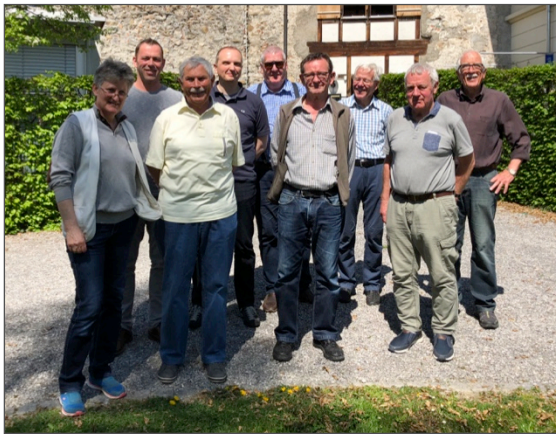
Das Team der diesjährigen Turmputzete