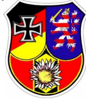
Deutsche Bundeswehr RK Giesel