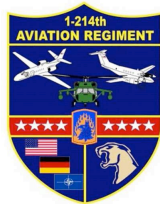
U.S. Army 1-214th Aviation Regiment